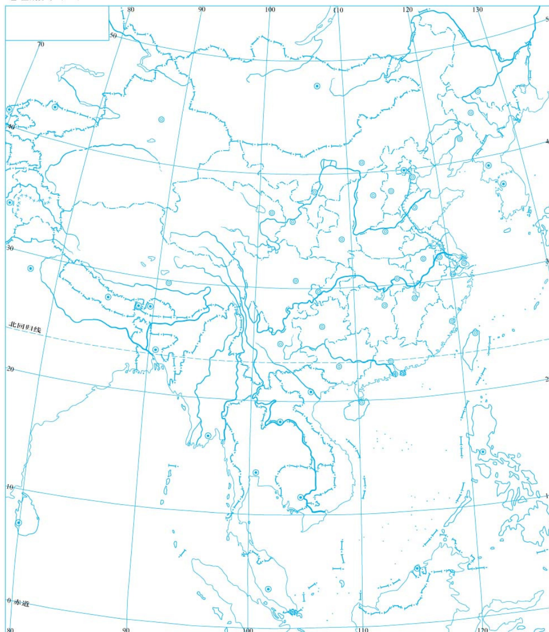
中国国界线系按照我社1989年出版的1:400万《中华人民共和国地形图》绘制